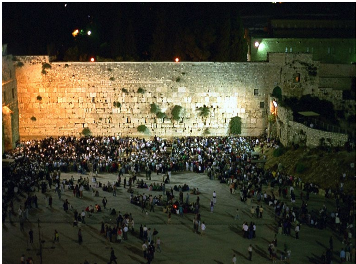
圣殿西墙 (哭墙 Wailing Wall)